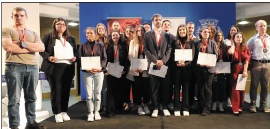
Les 26 lauréats du « prix de l'apprentissage » à l'issue de la cérémonie.

Pour cette cérémonie, la SMLH a sélectionné des établissements de formation en alternance varois. Chaque